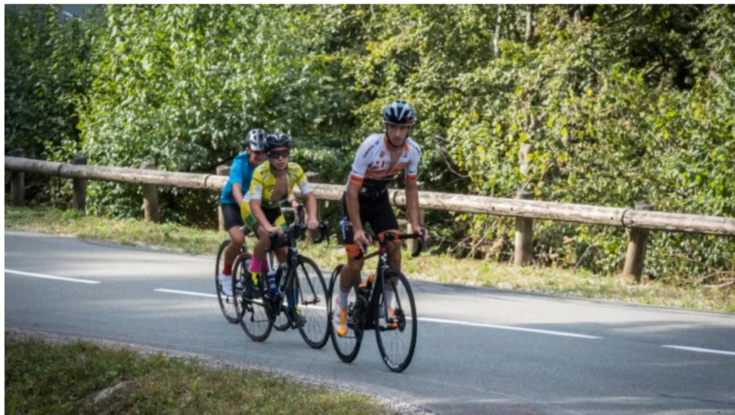
Les collégiens dans la montée de la Planche des Belles Filles

Trois jours avant le contre-la-montre de la 20e étape du Tour de France, entre Lure et La Planche des Belles Filles, 18 collégiens ont effectué, ce mercredi, une partie de l'étape : des élèves de la section cyclisme sur route du collège de Faucogney.