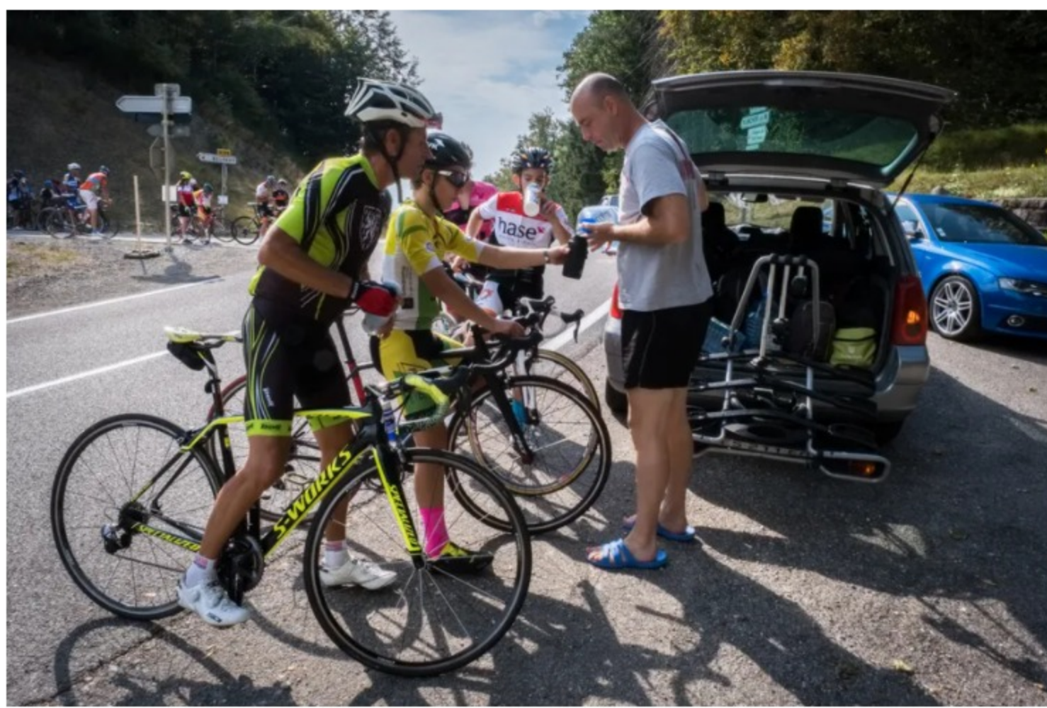
Ravitaillement au sommet du col de la Chevestraye

Habités à sillonner les routes du secteur, les collégiens ont gravi La Planche, dont le premier kilomètre est le plus difficile. Au sommet, ils se sont attaqués au mur d'arrivée à 20% de dénivelé. Les plus téméraires ont même enchaîné avec la Super Planche et ses 24%, sur un kilomètre.