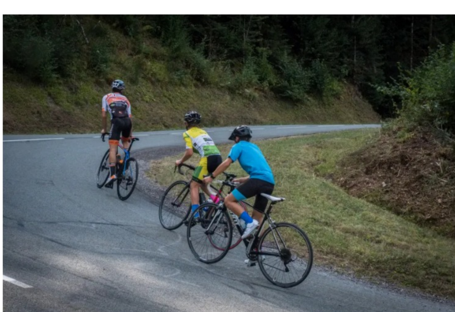
La montée de la Planche dans un des virages

En France, il n'existe que deux collèges qui proposent une section cyclisme sur route . Faucogney est l'un des deux. Le recrutement des élèves se fait dans le Grand Est, au-delà de la Bourgogne Franche-Comté. La section compte 18 élèves, dont 15 sont internes.