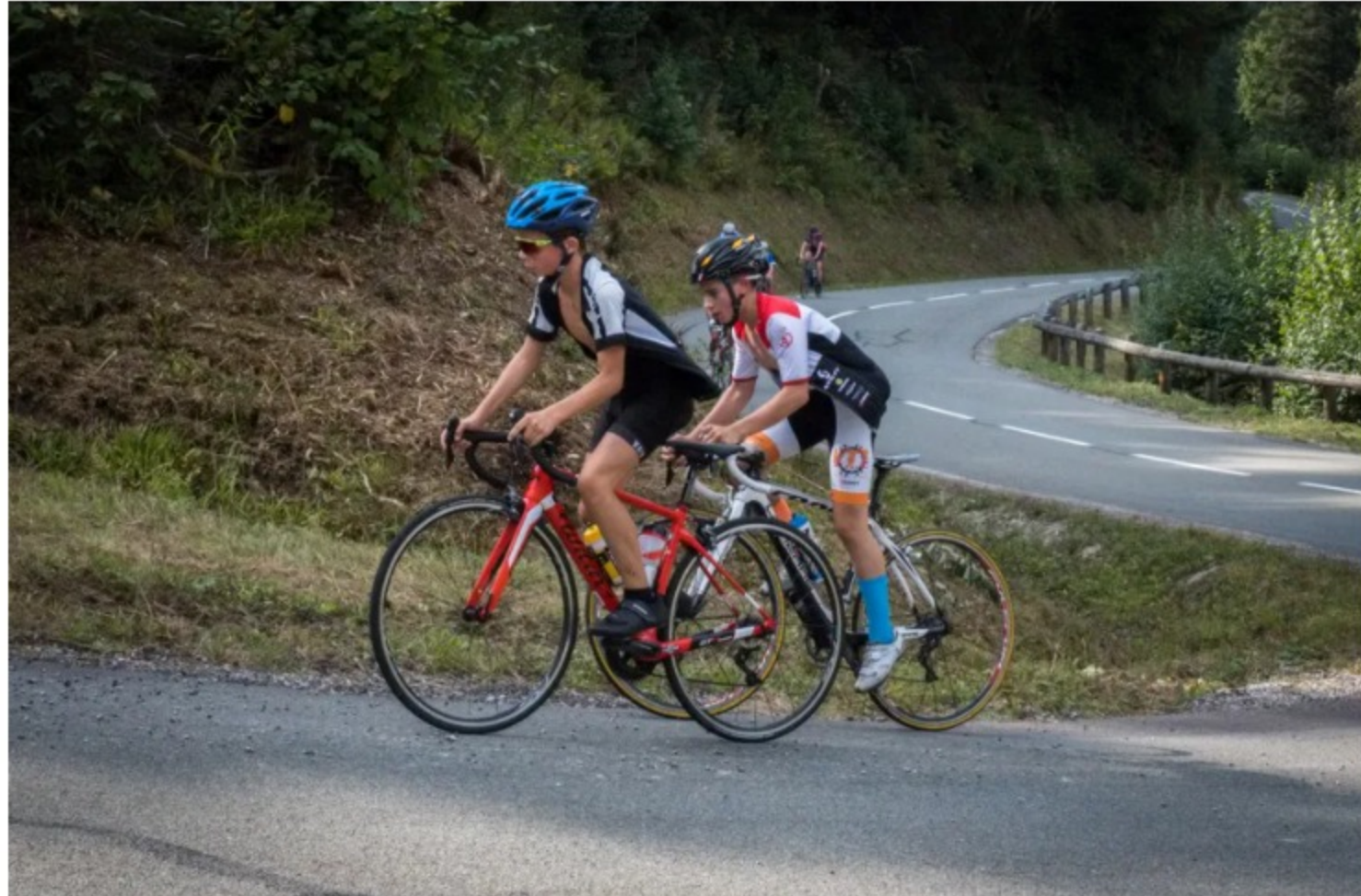
Les collégiens dans un des virages de la montée de la Planche des Belles Filles

Habités à sillonner les routes du secteur, les collégiens ont gravi La Planche, dont le premier kilomètre est le plus difficile. Au sommet, ils se sont attaqués au mur d'arrivée à 20% de dénivelé. Les plus téméraires ont même enchaîné avec la Super Planche et ses 24%, sur un kilomètre.